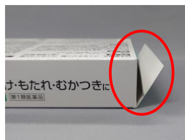
糊付けされていない