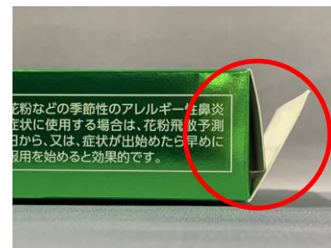
糊付けされていない