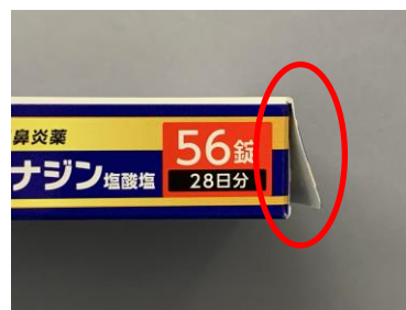
糊付けされていない