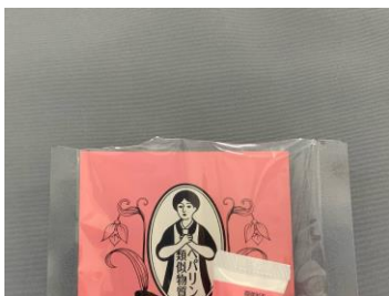
パウチが切れている