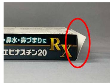
糊付けされていない