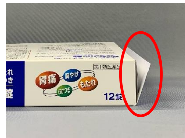
糊付けされていない